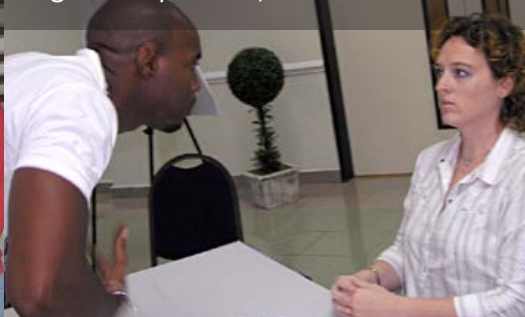
Workshop Omgaan met Agressie op school, NA-CSI