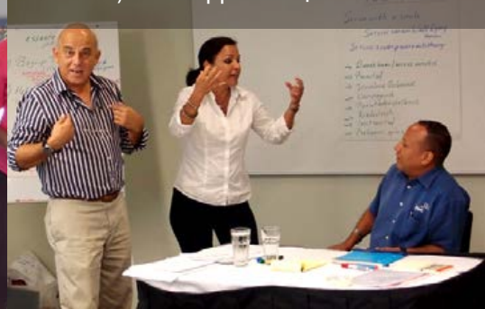
Training Omgaan met veeleisende klanten, PwC Support Staf