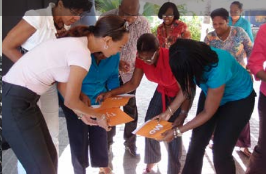
Training Teambuilding, Curoil