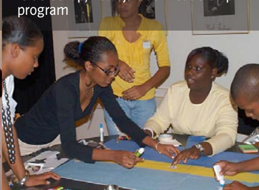
Training Communicatie, cultuur en leiderschap, Rotary Youth Leadership program