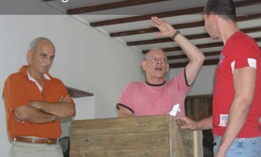
Workshop Professionele trainingsacteurs