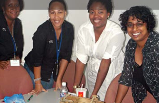
Training Klantgericht telefoneren, UTS Call center